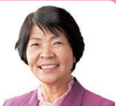
知事予定候補 ふるた みちよ